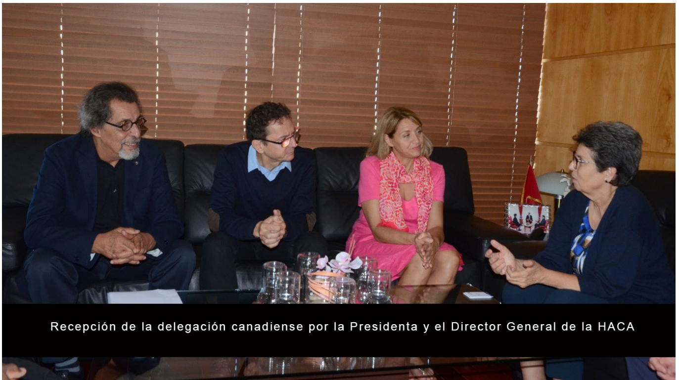
Recepción de la delegación canadiense por la Presidenta y el Director General de la HACA