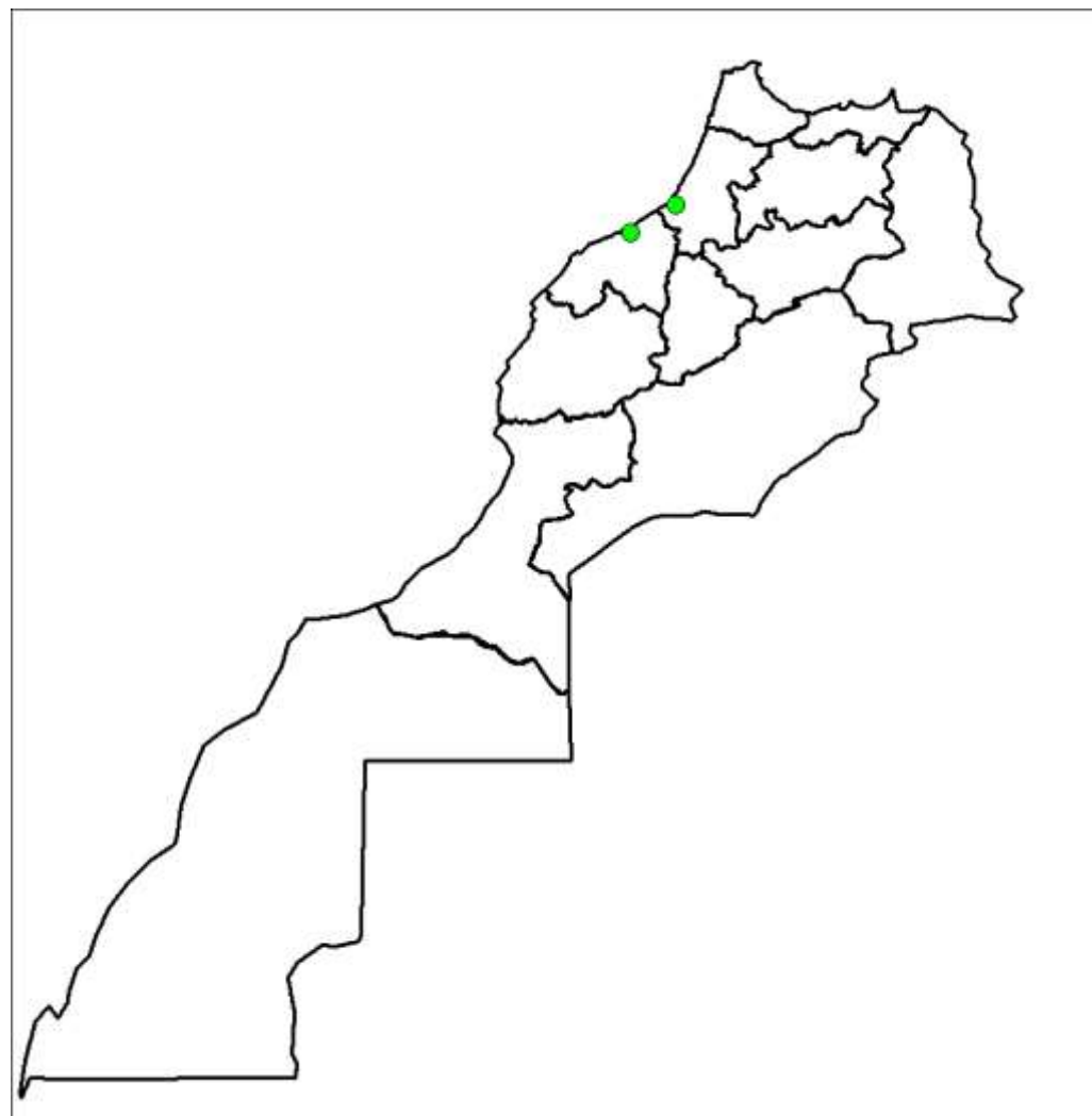
Le taux de couverture du réseau TNT en DVB-T2 atteint 21% de la population nationale.